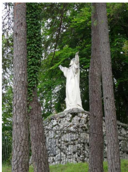
Statue de Saint Bernard de Clairvaux

C'est à l'initiative du groupe de laïcs cisterciens de « La Grange de Clairvaux » en lien avec les moines de l'abbaye cistercienne de Cîteaux (Côte d'Or) qu'ont eu lieu ces journées fraternelles.