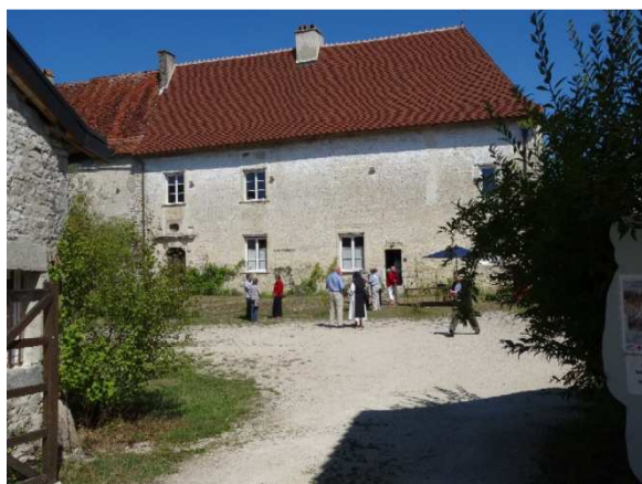
Grange cistercienne d'Outre-Aube