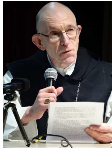
Dom Olivier Quenardel, Abbé de Cîteaux