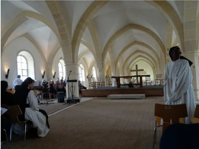
Abbaye de Clairvaux - Dortoir des convers (12 s. )