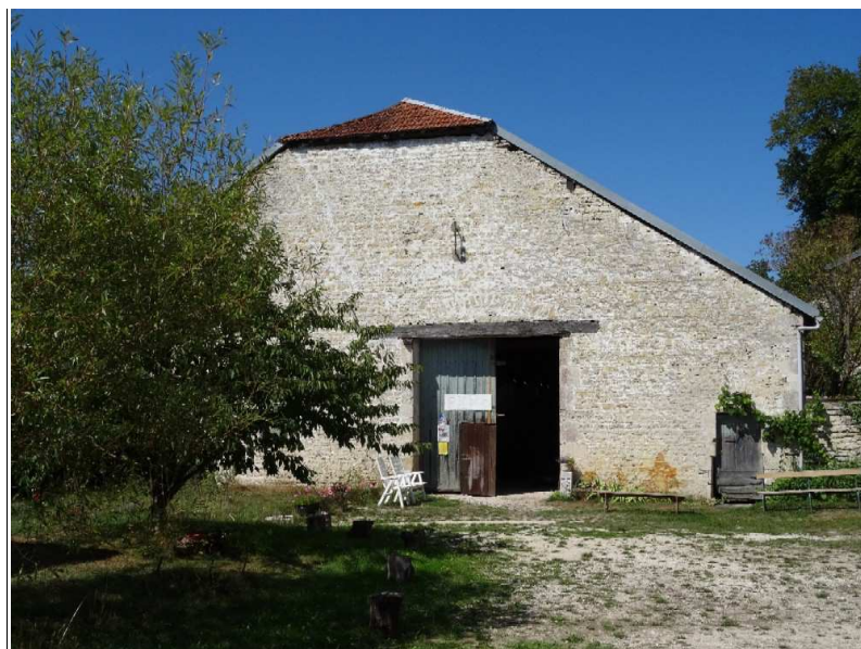
Grange cistercienne d'Outre-Aube

Un gros travail de préparation a été effectué par les paroisses environnantes (aménagement du lieu, chorales) et le jour même par les services de sécurité de la Centrale qui s'inquiétaient un peu d'une telle affluence malgré badges et cartes d'identité obligatoires . Une messe qui restera sans nul doute longtemps dans les mémoires. Saint Bernard lui-même , d'où il se trouve, a dû en être très touché ! Après un repas servi dans le superbe lavoir des moines, l'après-midi était à la carte : visite guidée de l'abbaye, promenade dans la vallée, magasin de l'Hostellerie des Dames, granges cisterciennes alentour dont celle d'Outre-Aube où on peut admirer une fort intéressante exposition sur la vie monastique d'autrefois.