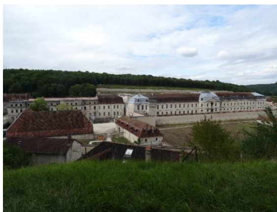
Abbaye de Clairvaux et Centre de détention

A CLAIRVAUX (Aube) a eu lieu du 19 au 21 août 2015 un rassemblement exceptionnel de moines, moniales et laïcs cisterciens qui, ensemble, fêtaient le 900 ième anniversaire de la fondation de l'abbaye de Clairvaux par saint Bernard (1115)