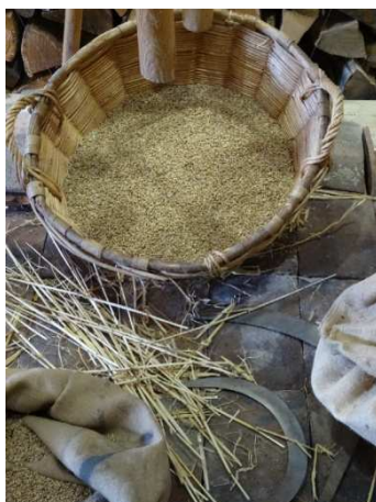
Exposition à la grange d'Outre-Aube

Le 21 août , les laïcs cisterciens se sont retrouvés dans leur maison-grange d'Outre-Aube pour faire connaissance, partager la vie de leurs équipes et prier ensemble dans leur oratoire en écoutant un texte de Saint Bernard de Clairvaux (comme chaque jour à 11h30 et ceci pendant un an) . La Grange a offert à ses frères et sœurs présents un repas simple et apprécié où les conversations allaient bon train.