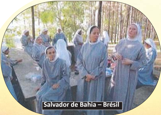
Salvador de Bahia – Brésil