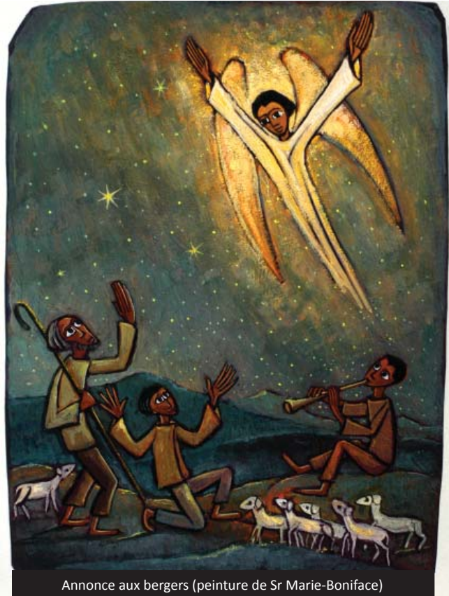
Annonce aux bergers (peinture de Sr Marie-Boniface)