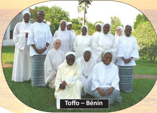
Toffo – Bénin