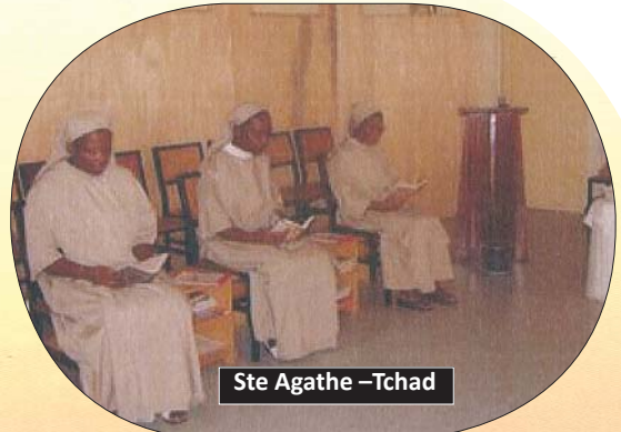
Ste Agathe – Tchad