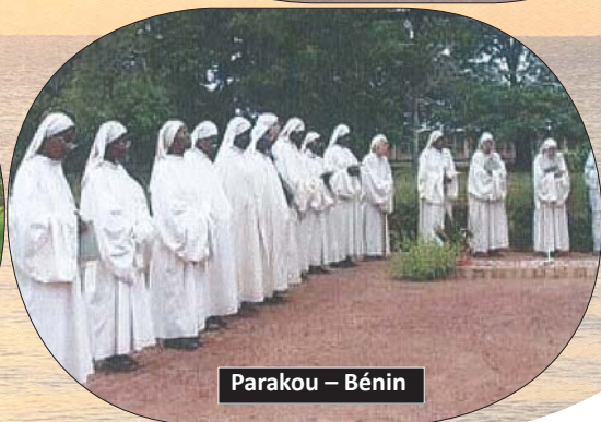
Parakou – Bénin