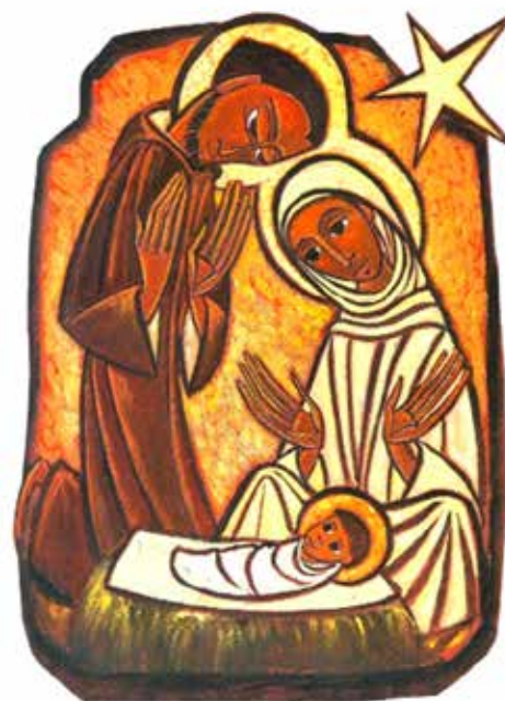
La Nativité par Sœur Marie-Boniface

© Entr'Aide Pax - Bénédictines de Vanves