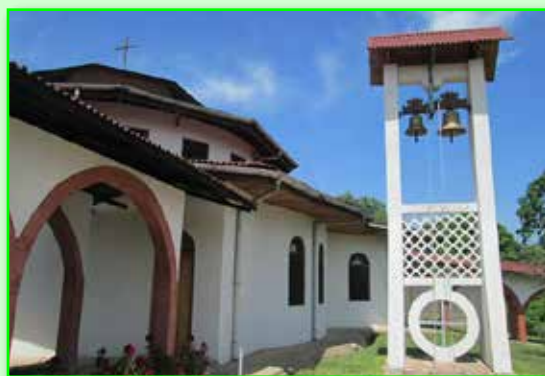
Monastère de Mvanda en RDC

reste du pays dans un état d'immense précarité et de pauvreté. Ils n'ont pas les moyens de financer eux-mêmes ce type de rencontre. Or il est indispensable de former le mieux possible les moines et moniales des communautés de RDC. C'est vraiment une question vitale pour ces monastères.