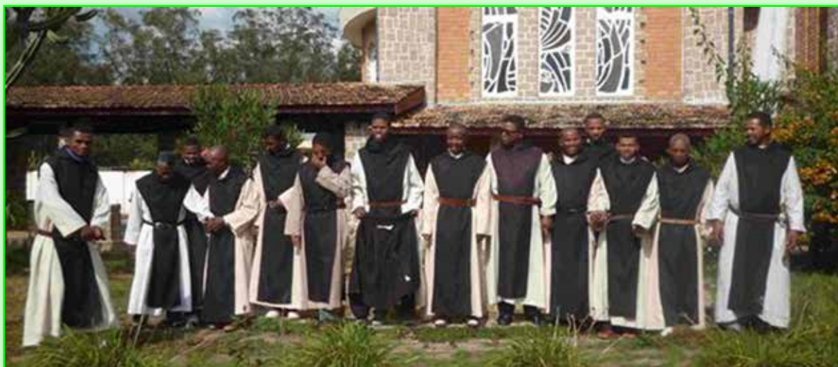
Voici une communauté cistercienne sur l'île de Madagascar, dans l'Océan Indien

essentiellement animiste, bouddhiste, indouiste. La vie des communautés monastiques y est intense. Il y a sur l'île 4 monastères de bénédictins et bénédictines, ainsi que 2 monastères de cisterciens et de cisterciennes.