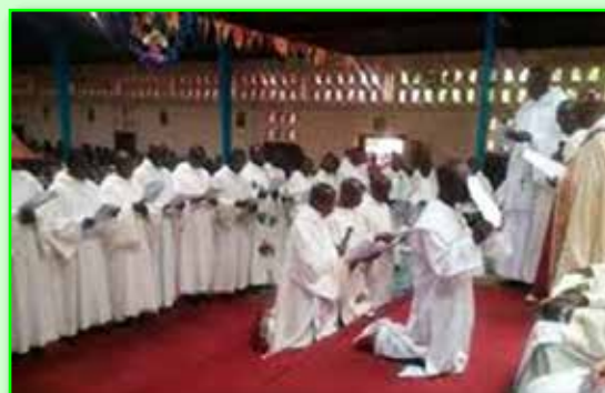
Engagement de trois frères dans la communauté

Le monastère a besoin de 7 000 € pour son Studium.