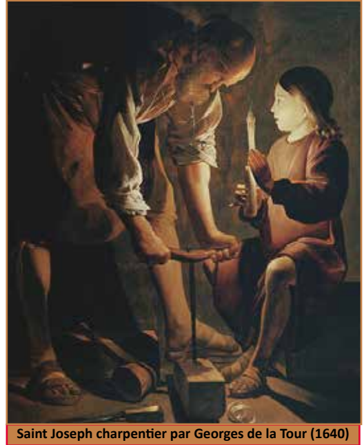
Saint Joseph charpentier par Georges de la Tour (1640)