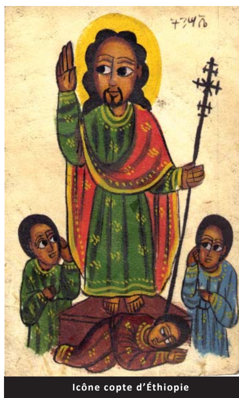
icône copte d'Éthiopie