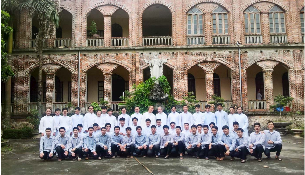
Châu Sơn (Norte do Vietnã)