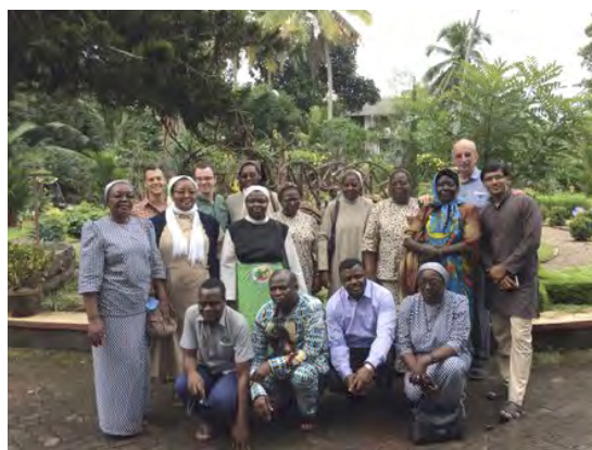
Sesión propuesta por la MAC (2016)