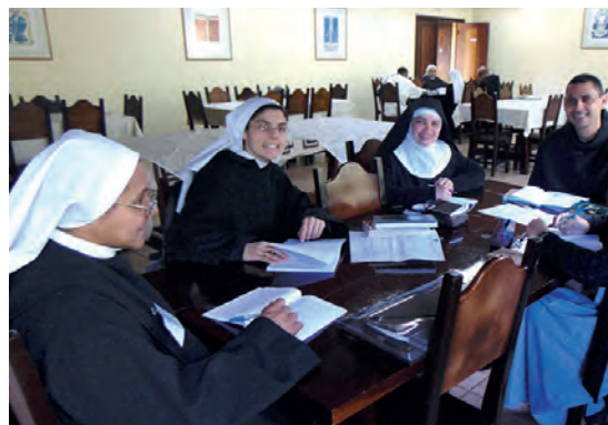
Sesión sobre la Regla de San Benito propuesta por CIMBRA JOVEM (2017).

Durante los últimos sesenta años, la AIM ha acompañado el nacimiento de varias estructuras continentales de solidaridad monástica. La mayoría de las regiones del mundo tienen organizaciones que permiten que los monasterios benedictinos, cistercienses y trapenses trabajen juntos.