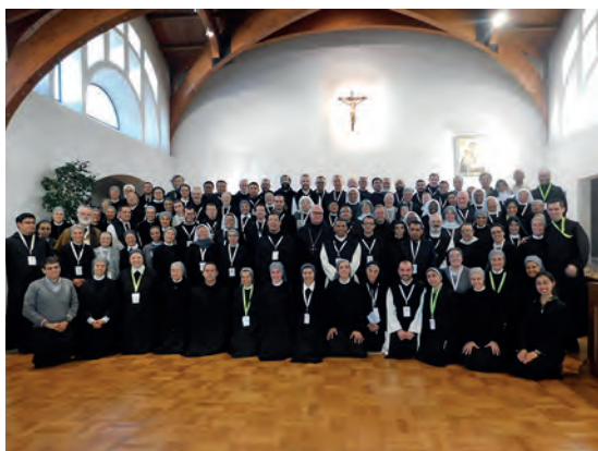
Asamblea de la EMLA (2019)