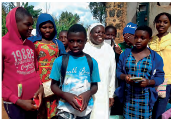
Ayuda en la construcción de un edificio para acoger refugiados (Babete, Camerún).

La prioridad de las ayudas sigue estando orientada a la formación donde las solicitudes son más numerosas.